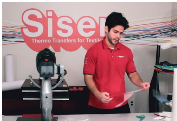
Retirar el papel protector blanco del transfer/transportador y dejar de lado. No tirarlo.