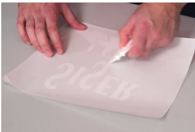
Colocar la imagen transferida al papel blanco de protección del transportador que se dejó a un lado

Recomendamos el uso de un laminador en frío en nuestro transfer/transportador para grandes series de producción