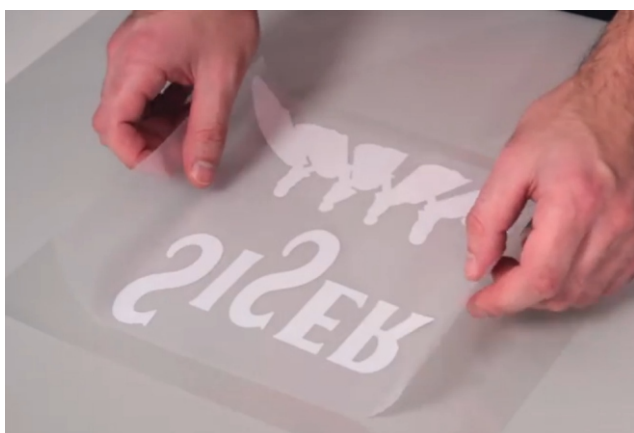
Colocar el transfer/transportador sobre una superficie plana y firme. El adhesivo del transfer hacia arriba. Con la imagen hacia abajo, centrarla y aplicarla sobre el transfer/transportador