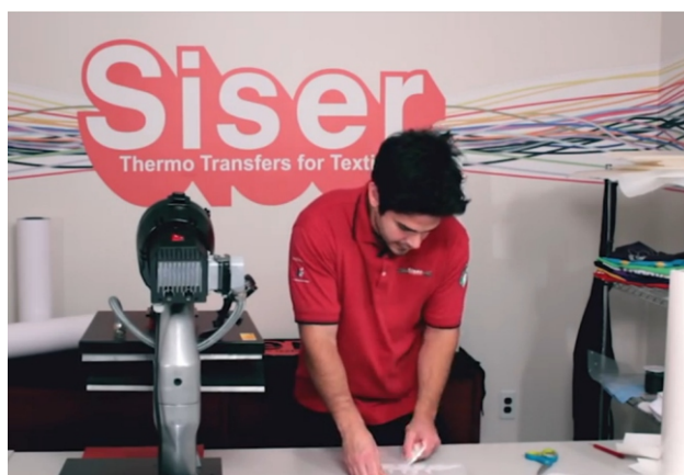
Colocar su espátula/ squeegee en un ángulo de 45 ° sobre el centro de la imagen. Usar una presión firme, empujar la espátula de goma del centro hacia afuera. Este paso elimina cualquier aire atrapado entre la imagen y el transfer/transportador. Repetir este proceso en varias direcciones.