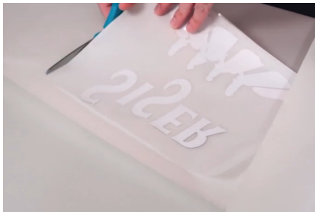
Cortar un pedazo de transfer/transportador ligeramente más grande que la imagen a transferir